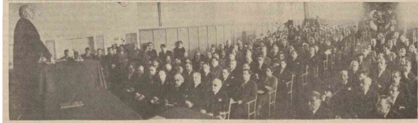
Dün açılan Neşriyat Kongresinde Başvekil nutuk söylerken

Neşriyat Kongresi, Başvekilin mühim bir nutkile dün açıldı Dr. REFİK SAYDAM DİYOR Kİ: « Millî kütüphaneyi köye kadar götürmek ve okuma zevkini idame ettirmek, kongrenin yapacağı esaslı bir programa tâbi olacaktır »